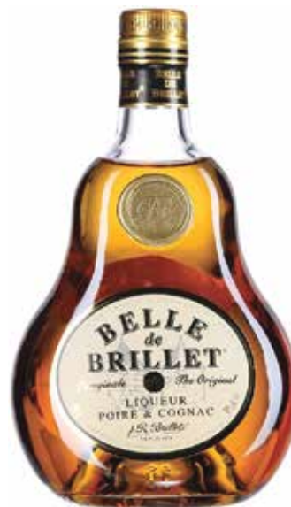
Belle de Brillet ▣ 7 5