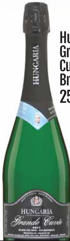
Hungaria Grande Cuvée Brut 25