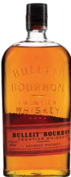
Bulleit Frontier Bourbon