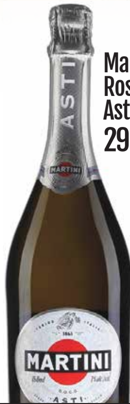
Martini & Rossi Asti 29 5