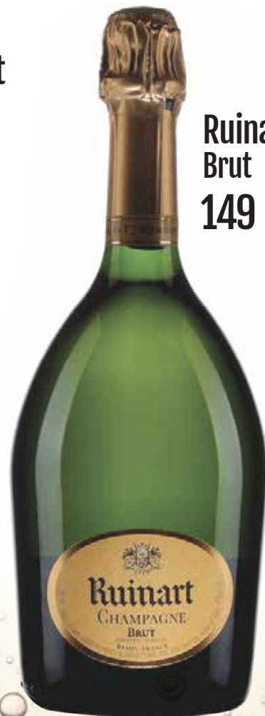
Ruinart Brut 149