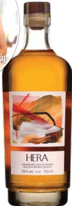
Hera Liqueur délicate de whisky