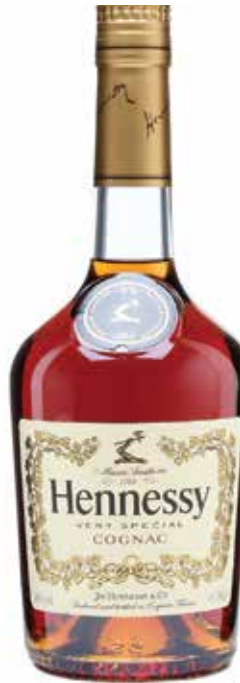
Hennessy V.S. ▣ 8 5