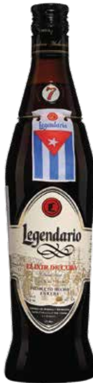
Ron Legendario Elixir de Cuba Rhum aromatisé 5 5