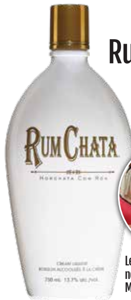
Rumchata Boisson à la crème (cannelle) 4 5