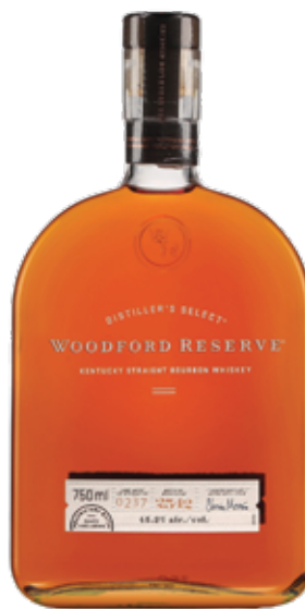
Woodford Reserve Straight Bourbon