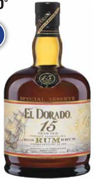
El Dorado 15 ans Special Reserve 7 5