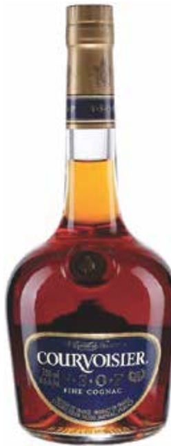
Courvoisier V.S.O.P. ▣ 8