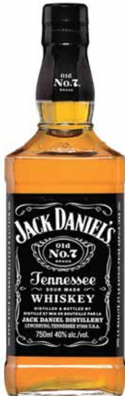
Jack Daniel's Old No. 7