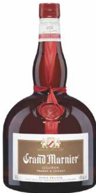
Grand Marnier ▣ 7 5