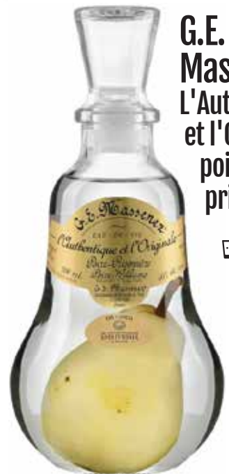
G.E. Massenez L'Authentique et l'Originale poire prisonnière 8