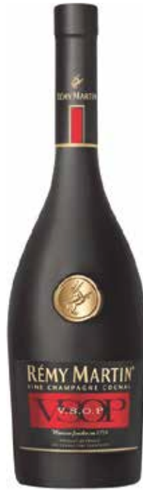
Remy Martin V.S.O.P. ▣ 9