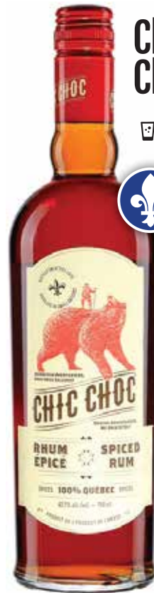
Chic Choc 5 5