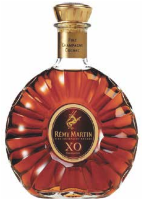
Remy Martin Excellence X.O. ▣ 24