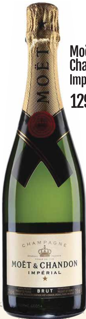
Moët & Chandon Impérial 129