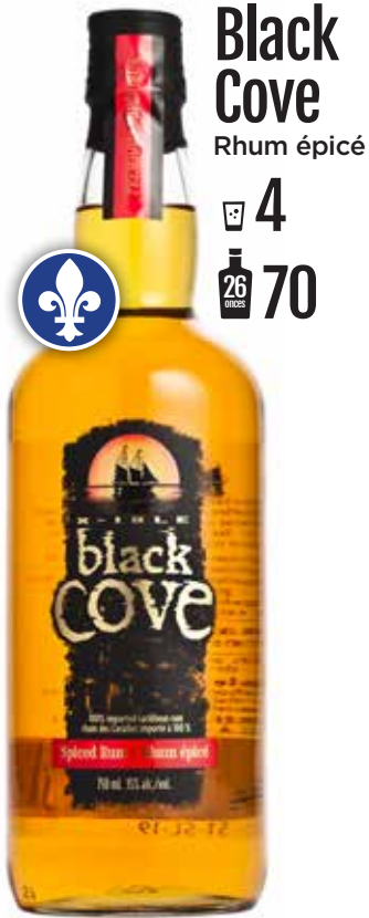
Black Cove Rhum épice 4 26 70