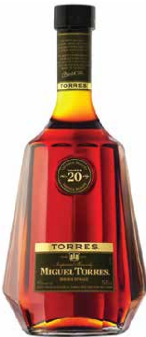
Torres 20 hors d'Age ▣ 9