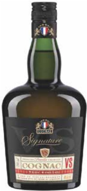
Global V.S. ▣ 6