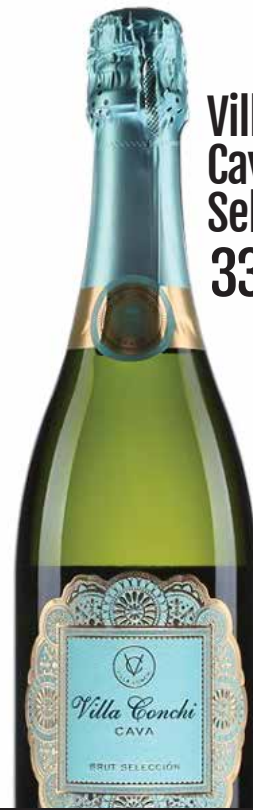
Villa Conchi Cava Brut Selección 33