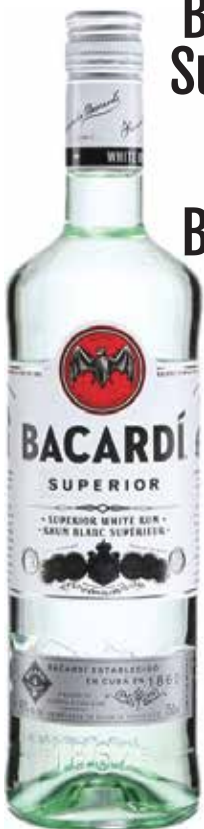
Bacardi Superior ou Bacardi Gold 4