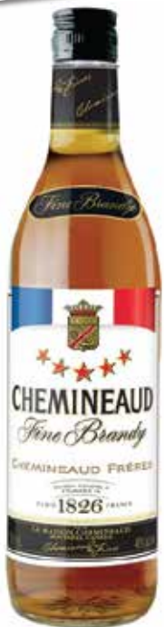
Chemineaud ▣ 5