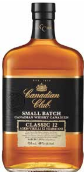
Canadian Club 12 ans