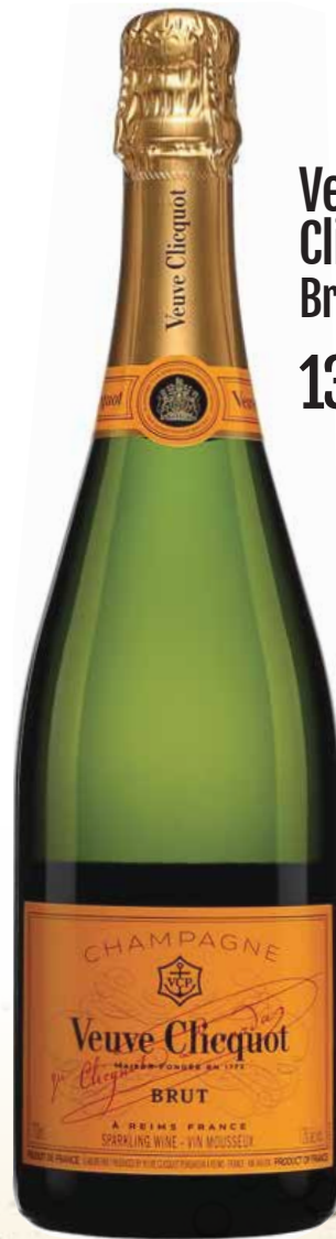
Veuve Clicquot Brut 139