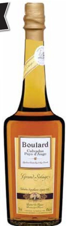
Calvados Boulard ▣ 7 5