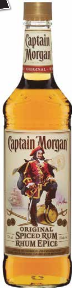
Captain Morgan Original Rhum épice ou Rhum brun Dark ou Rhum blanc 4 5