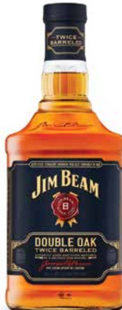
Jim Beam Double Oak